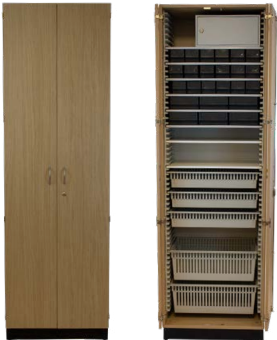
Hoge kast 2100 mm