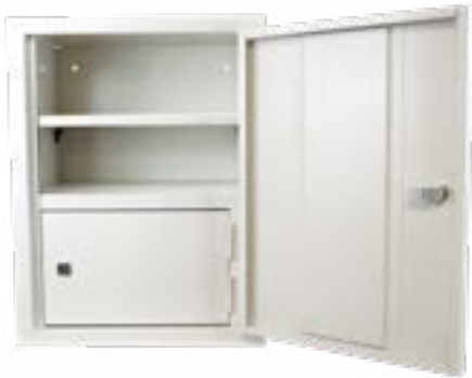
Type 308.58 model met één legschap en een opiatenkastje

Hoogte: 500 mm | Breedte: 380 mm | Diepte: 350 mm