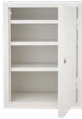
Type 308.57 model met drie verstelbare legschappen