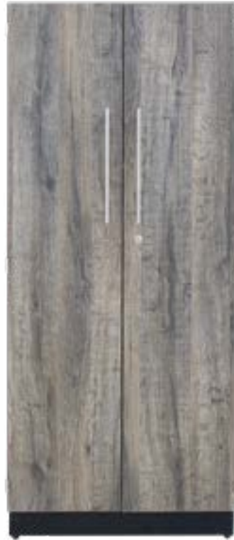
Middelhoge kast 1500 mm

Alle huiselijke kasten zijn standaard voorzien van grote handgrepen voor een optimale grip.