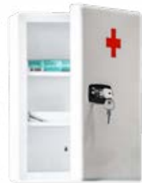
Type BMK4 model met cijfercombinatieslot