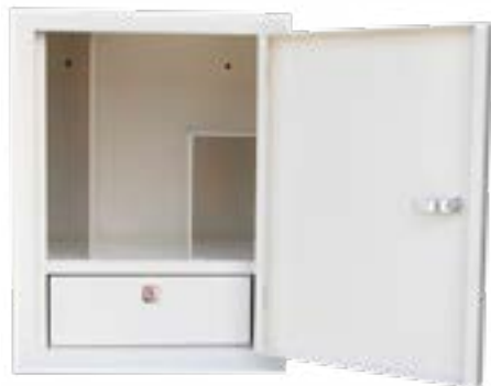
Type MK3 model met ruimte voor dossiervak, baxtervakje en een separaat opiatenlaatje

Type 308.57 en 308.58 zijn ook uit te rusten met medicijnbakken MB3010 en MB3020.