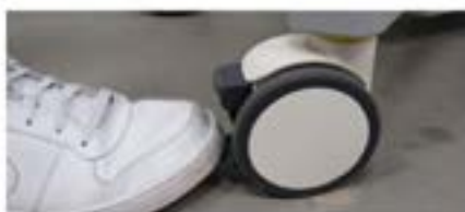
Op de rem zetten; voetbeweging van boven naar beneden.