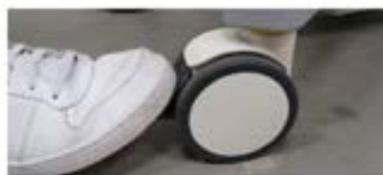
Van de rem halen; dezelfde voetbeweging van boven naar beneden.